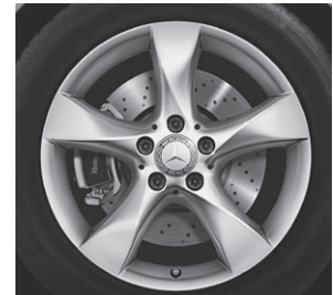
Bremsscheiben vorne gelocht