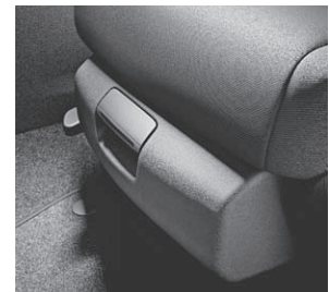
Ablagebox unter den Vordersitzen, Ablage-Paket