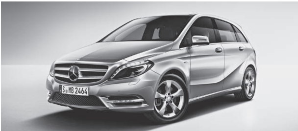
Sport-Paket (Darstellung mit Intelligent Light System)