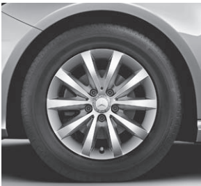
40,6 cm (16") Leichtmetallräder im 10-Speichen-Design (55R)