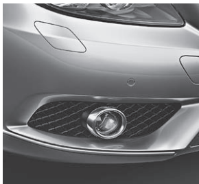
Stoßfänger vorne mit Chromapplikationen

1) nicht in Verbindung mit Sport-Paket, Code 952, oder Night-Paket, Code P55