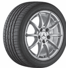
40,6 cm (16") Leichtmetallrad im 5-Doppelspeichen-Design