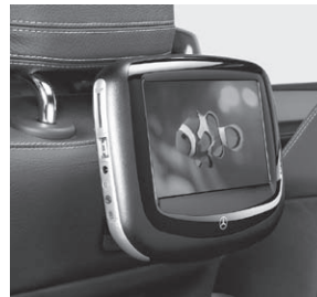
Fond Entertainment System