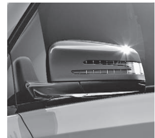
Außenspiegel schwarz lackiert