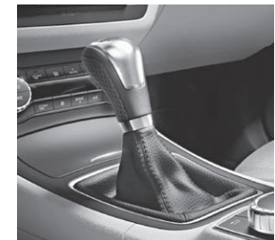
Schalthebel mit Applikationen in Silberchrom (Darst. m. Klimatisierungsautomatik)