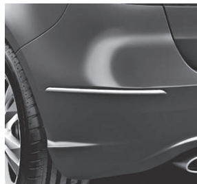
Stoßfänger hinten mit Chromapplikationen