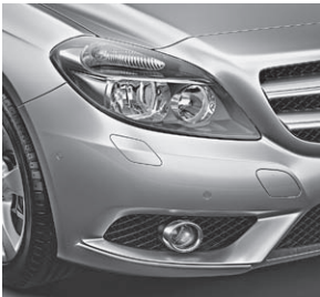
Reflexionscheinwerfer, LED-Tagfahrlicht rund