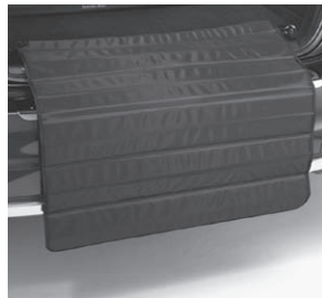
Zick-Zack-Ladekantenschutz (Abbildung ähnlich)