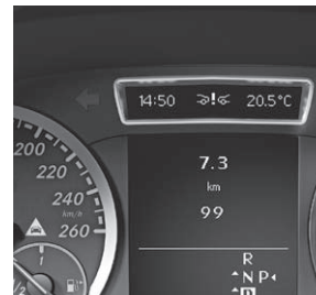
Kombiinstrument, COLLISION PREVENTION ASSIST