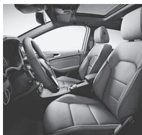
Exklusiv-Paket (P34) basierend auf Sport-Paket