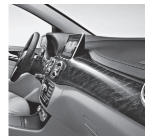
Zierelemente Holz Esche schwarz glänzend