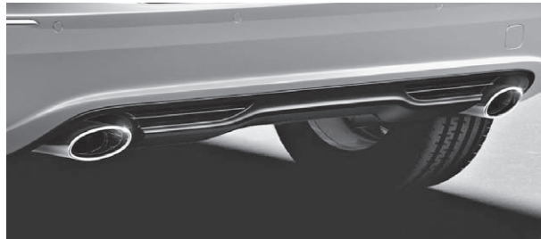
Abgasanlage doppelflutig mit ovalen Endrohrblenden in Edelstahl