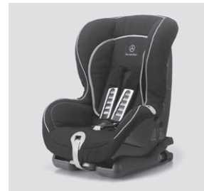
Kindersitz DUO Plus