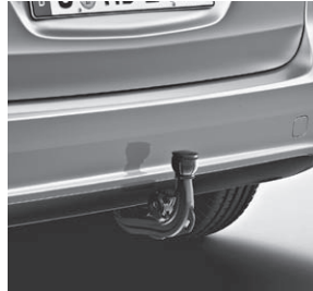
Anhängevorrichtung mechanisch abklappbar