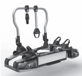
Heckfahrradträger für Anhängervorrichtung