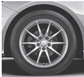
43,2 cm (17") Leichtmetallräder im 10-Speichen-Design (R43)