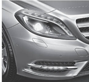
Intelligent Light System