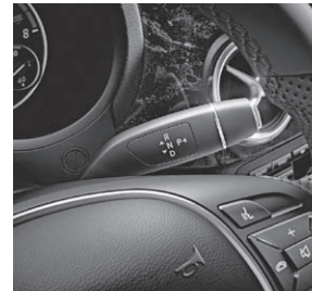
DIRECT SELECT-Schaltung in Verbindung mit 7G-DCT