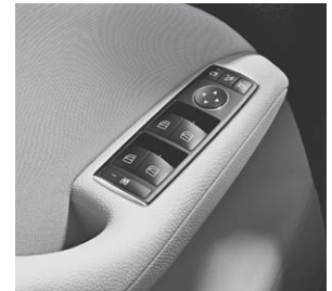
Fensterheber elektrisch 4-fach