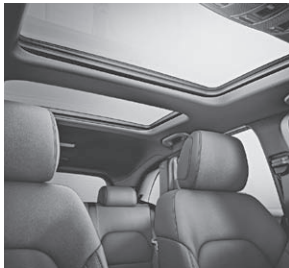
Panorama-Schiebedach mit schwarzem Innenhimmel