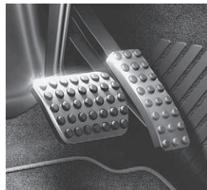
Sportpedalanlage aus gebürstetem Edelstahl mit Guminoppen