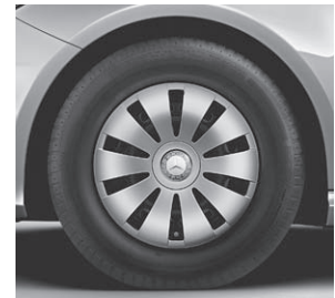
40,6 cm (16") Stahlrad mit Radzier- blende im 10-Loch-Design (643)