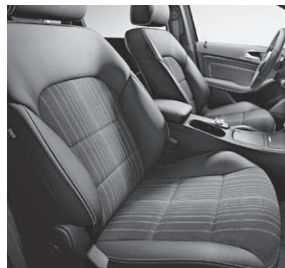
Sitze in Ledernachbildung ARTICO/Stoff Den Helder (Darstellung mit 7G-DCT)