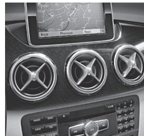
Luftaustrittsdüsen mit Düsenring und -kreuz in Silberchrom (Darstellung mit COMAND)