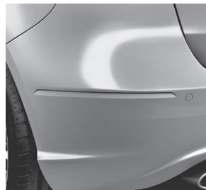
Heckstoßfänger ohne Chromapplikationen