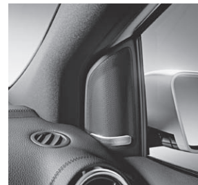
Harman Kardon® Logic 7® Surround-Soundsystem