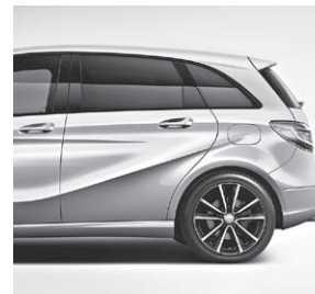
Wärmedämmend dunkel getöntes Glas ab B-Säule