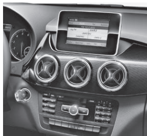
Audio 20 CD