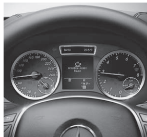
Kombiinstrument, ATTENTION ASSIST