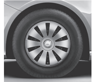
38,1 cm (15") Stahlrad mit Radzierblende im 10-Loch-Design (R00)