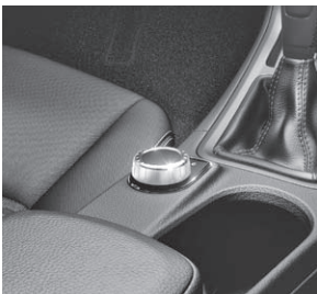
Controller auf Mittelkonsole