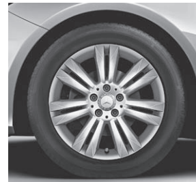
43,2 cm (17") Leichtmetallräder im 7-Doppelspeichen-Design (26R)