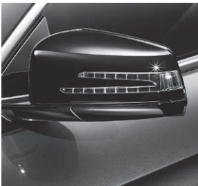
Außenspiegelgehäuse, hochglanz schwarz