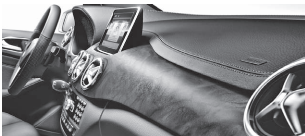
Zierelemente Holz Wurzelnuss braun seidenmatt