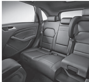
Fondsitze mit integrierten Kindersitzen