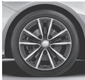
Leichtmetallräder im 5-Doppelspeichen-Design (01R)