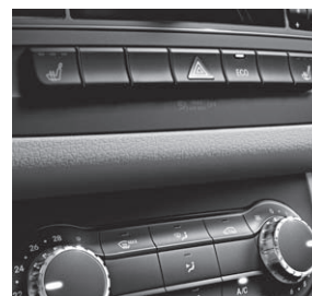
Sitzheizung für Fahrer und Beifahrer