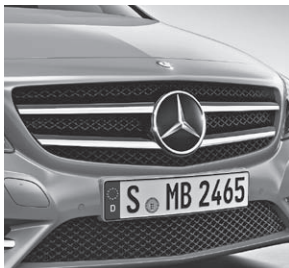
Kühlergrill mit Doppellamellen

3) nicht in Verbindung mit anderen Rädern. Ausnahme: Winter-Komplettträger, Code 1R2, 2R9 oder 3R7 zusätzlich mit TIREFIT, Code B51