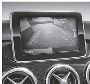
Rückfahrkamera (Darstellung mit COMAND)