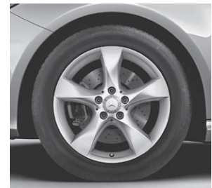
Leichtmetallräder im 5-Speichen-Design (R24)