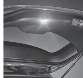
Warn-/Umgebungslicht in der Heckklappe