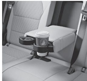
Armlehne im Fond