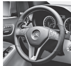
Multifunktions-Sportlenkrad (Darstellung mit Fahrersitz elektr. verstellbar mit Memory-Funktion)