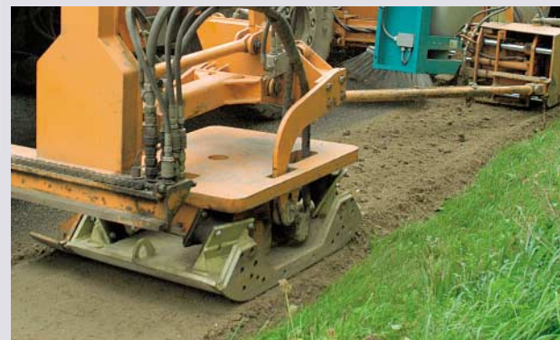
... verdichten ...

► Gemeinsam entwickelten sie ein integriertes System, das bisherigen Verfahren weit überlegen ist. Mit dem Unimog U 500 als Geräteträger und einer Kombination aus sechs Arbeitsgeräten. Bis zu 1.500 t Baumaterial wie Asphalt, Schotter,