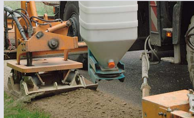
Bankett-Einbau wie aus einem Guss: fertigen ...