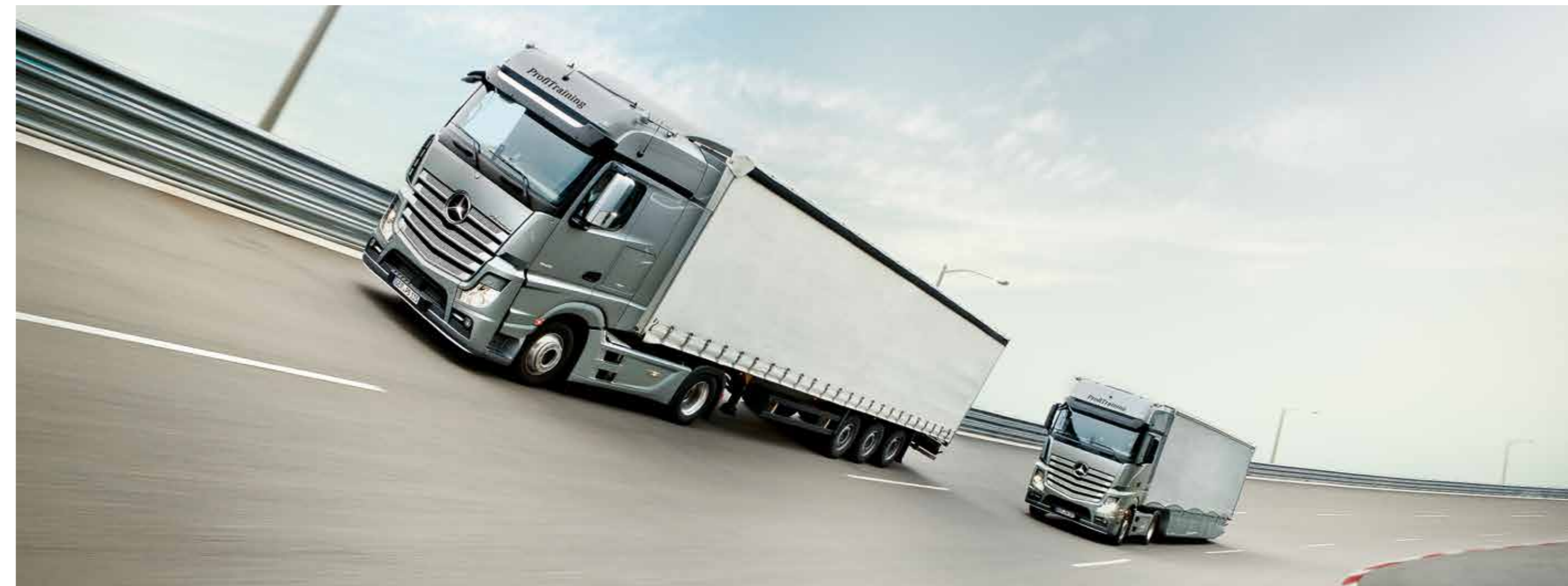
Während der Fahrsicherheitstrainings lernen Sie, wie Sie zum Beispiel effektiver bremsen können und Gefahrensituationen meistern.

Kenntnisbereich: 1. Verbesserung des rationellen Fahrverhaltens (1.1, 1.2)