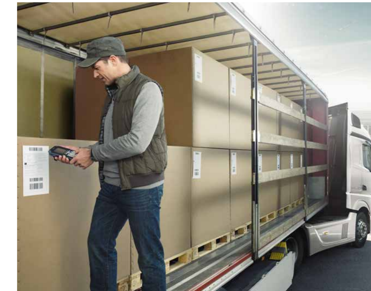
Eine erfolgreiche Fahrt beginnt beim Laden. Im Ladungssicherungstraining erfahren Sie, wie man seinen Lkw effizient, sicher und rechtlich einwandfrei belädt.

Kenntnisbereich: 3. Gesundheit, Verkehr und Umwelt, Dienstleistung und Logistik (3.1, 3.2, 3.3, 3.4, 3.5, 3.6, 3.7)