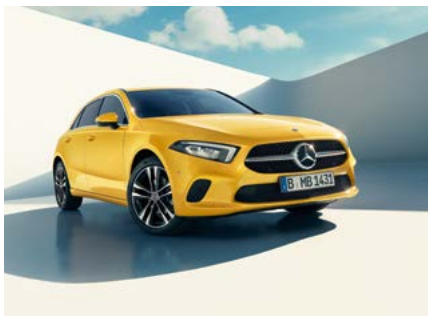
A-Klasse Kompaktlimousine EDITION 19