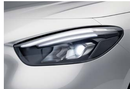
LED High Performance-Scheinwerfer (632)