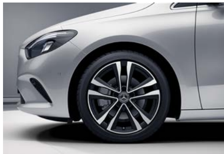
45,7 cm (18“) Leichtmetallräder im 5-Doppelspeichen-Design (66R)

Advanced Soundsystem mit 10 Lautsprechern und 225 Watt Systemleistung. Mit dem Soundsystem steigern Sie Ihren Fahrspaß auch akustisch. Das exakt auf den Innenraum abgestimmte Lautsprechersystem bietet Ihnen dabei eine dynamische Musikwiedergabe.