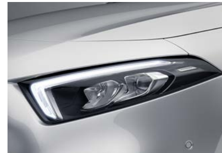
LED High Performance-Scheinwerfer (632)