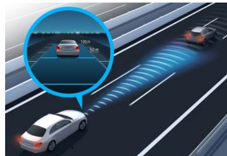
Advanced Assistenz-Paket (D2F)