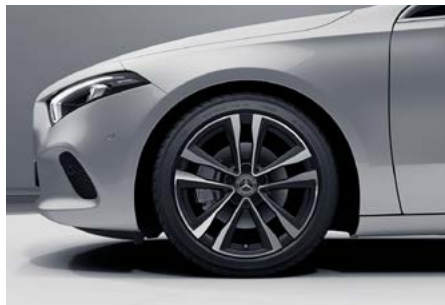
45,7 cm (18“) Leichtmetallräder im 5-Doppelspeichen-Design (66R)

Advanced Soundsystem mit 10 Lautsprechern und 225 Watt Systemleistung. Mit dem Soundsystem steigern Sie Ihren Fahrspaß auch akustisch. Das exakt auf den Innenraum abgestimmte Lautsprechersystem bietet Ihnen dabei eine dynamische Musikwiedergabe.