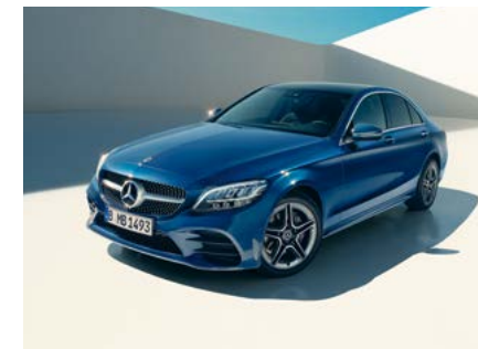
C-Klasse Limousine EDITION 19