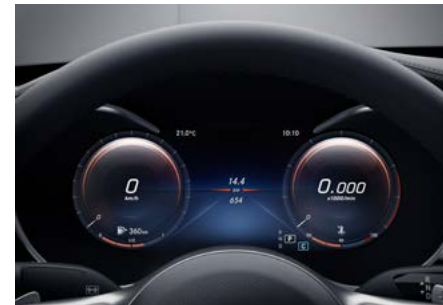
Volldigitales Instrumenten-Display (464)