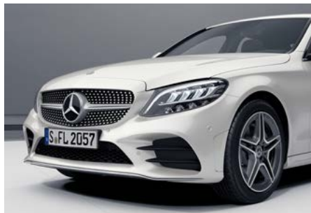
AMG Line Exterieur (P31)

Das volldigitale Instrumenten-Display mit den Anzeigestilen „Klassisch“, „Progressiv“ und „Sportlich“ lässt Sie darüber entscheiden, welche Informationen Ihnen wichtig sind und auf welche Art sie angezeigt werden. Das 31,2 cm (12,3") große Display liefert ein gestochen scharfes Bild, das sich bei allen Lichtverhältnissen sehr gut ablesen lässt.