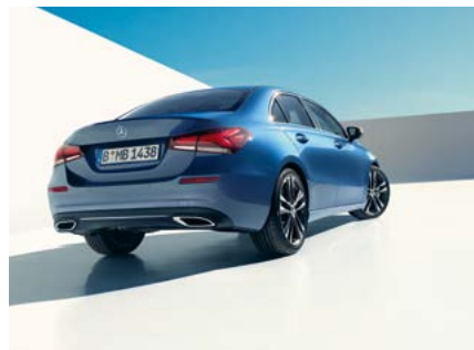
A-Klasse Limousine EDITION 19