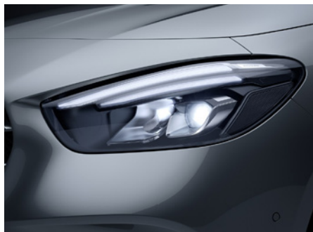
LED High Performance-Scheinwerfer

Die beheizte Scheibenwaschanlage sorgt für freien Durchblick und unterstützt somit eine sichere Fahrt auch bei kalten Temperaturen. Sie kann unter anderem das im Winter typische Vereisen verhindern. So können Sie Ihre Frontscheibe möglichst optimal reinigen.