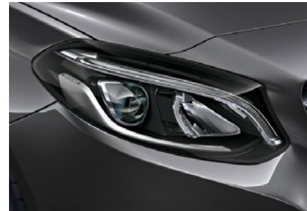
LED High Performance-Scheinwerfer