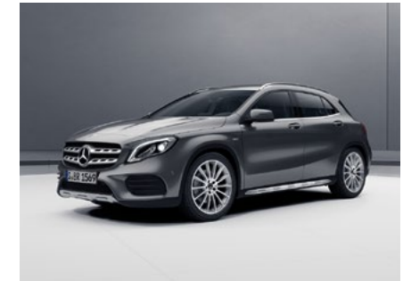
GLA UrbanStyle Edition