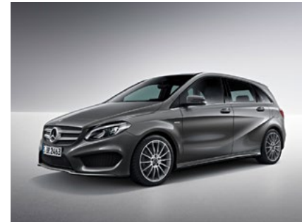
B-Klasse UrbanStyle Edition