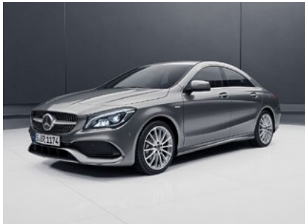
CLA Coupé UrbanStyle Edition