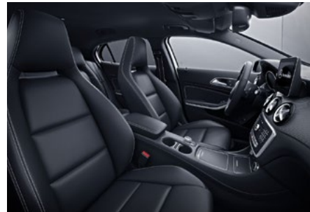
Polsterung Ledernachbildung ARTICO schwarz mit Kontrastziernähten in Weiß