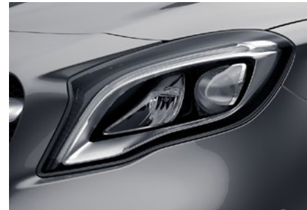
LED High Performance-Scheinwerfer