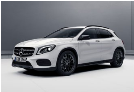
Aufwahl (optional): Night-Paket

Das freistehende 8"-Media-Display garantiert optimale Lesbarkeit in brillanter Bildqualität. Die Bildschirmdiagonale von 20,3 cm (8") ist gegenüber dem serienmäßigen Display um 2,5 cm (1") vergrößert. So hat der Fahrer Assistenzsysteme, Navigation, Entertainment und Reiseinformationen noch besser im Blick.