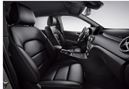
Polsterung Ledernachbildung ARTICO schwarz mit Kontrastziernähten in Weiß