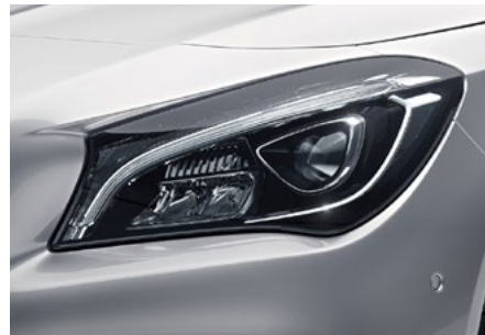
LED High Performance-Scheinwerfer