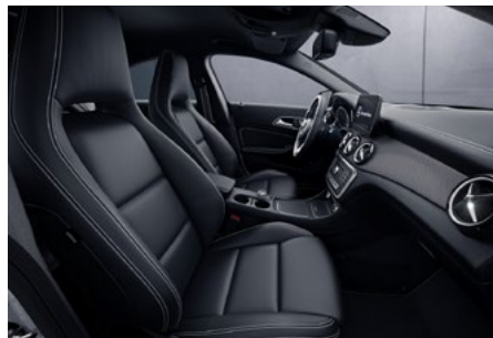
Polsterung Ledernachbildung ARTICO schwarz mit Kontrastziernähten in Weiß