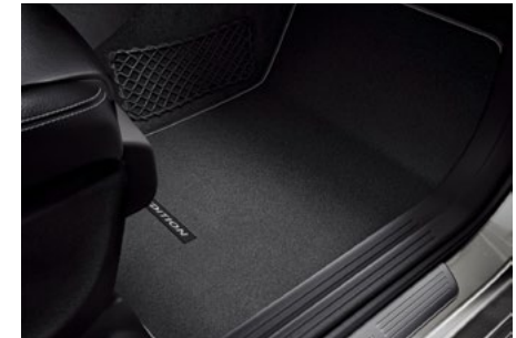
Fußmatten in Schwarz mit „EDITION“-Schriftzug