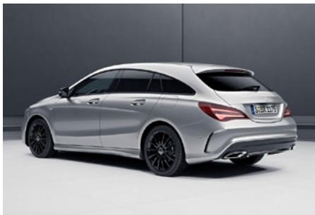
Aufwählbar (optional): Night-Paket

Das freistehende 8"-Media-Display garantiert optimale Lesbarkeit in brillanter Bildqualität. Die Bildschirmdiagonale von 20,3 cm (8") ist gegenüber dem serienmäßigen Display um 2,5 cm (1") vergrößert. So hat der Fahrer Assistenzsysteme, Navigation, Entertainment und Reiseinformationen noch besser im Blick.