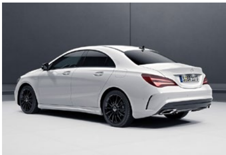
Aufwählbar (optional): Night-Paket

Das freistehende 8"-Media-Display garantiert optimale Lesbarkeit in brillanter Bildqualität. Die Bildschirmdiagonale von 20,3 cm (8") ist gegenüber dem serienmäßigen Display um 2,5 cm (1") vergrößert. So hat der Fahrer Assistenzsysteme, Navigation, Entertainment und Reiseinformationen noch besser im Blick.