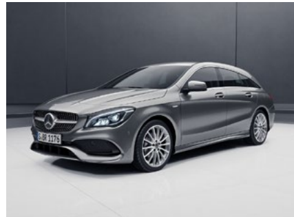
CLA SB UrbanStyle Edition