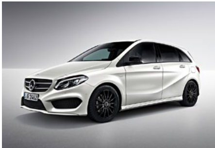
Aufwahl (optional): Night-Paket

Das freistehende 8"-Media-Display garantiert optimale Lesbarkeit in brillanter Bildqualität. Die Bildschirmdiagonale von 20,3 cm (8") ist gegenüber dem serienmäßigen Display um 2,5 cm (1") vergrößert. So hat der Fahrer Assistenzsysteme, Navigation, Entertainment und Reiseinformationen noch besser im Blick.